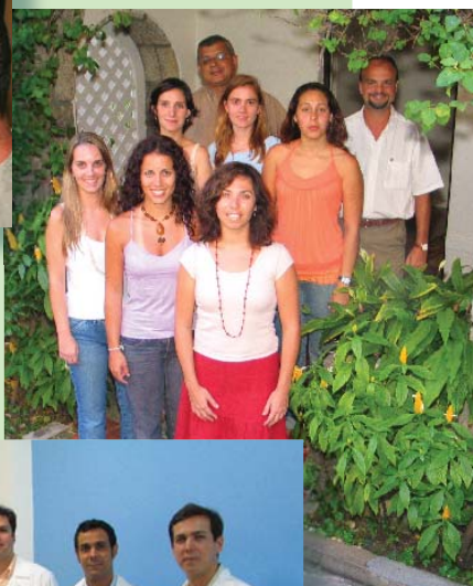
Equipe da Saúde Mental, em 2005, na casa do Jardim Botânico