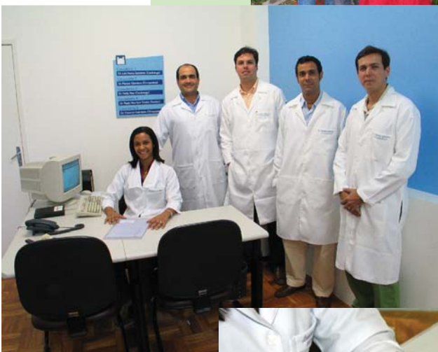
Na primeira expansão física, Cardiologia e Ortopedia

ternados não contavam com o mesmo tipo de atendimento. A visita veio então com o objetivo de estender o cuidado médico desempenhado nos consultórios da Policlínica às internações. Ao mesmo tempo, o programa cria um vínculo com pacientes e suas famílias. Os casos de usuários internados que não contam com médicos assistentes na internação são assumidos pelos médicos especialistas do programa de visita hospitalar.