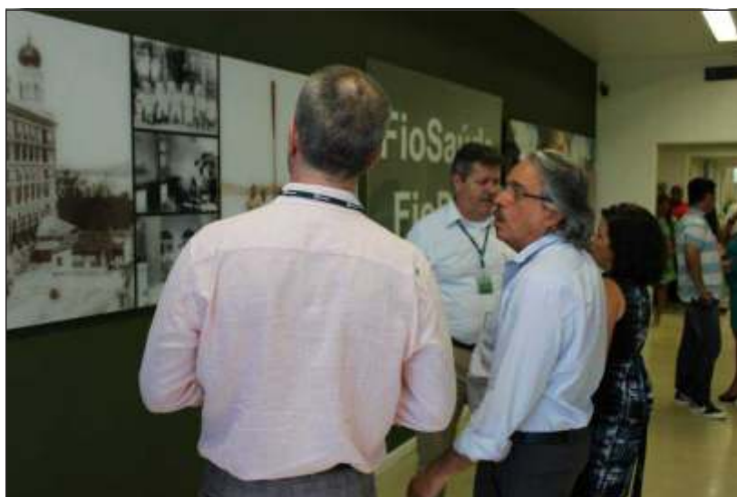
Presidência da Fiocruz e Diretoria da FioSaúde na inauguração da ampliação da Policlínica, em 04 de dezembro