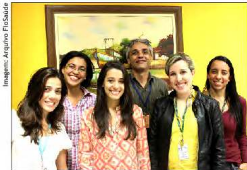
Equipe do Circuito Saudável Fiocruz reunida com representantes da Policlínica FioSaúde.

Este é o objetivo do projeto institucional Circuito Saudável - desenvolvido pela equipe de nutrição do Núcleo de Saúde do Trabalhador (Nust) da CST/Dirh/Fiocruz, o qual conta com o apoio de parceria da FioSaúde.