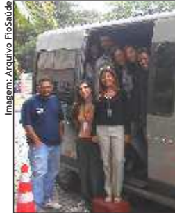
Caravana de doadores em 24/6

A ação solidária fez parte do calendário de campanhas de promoção da saúde.