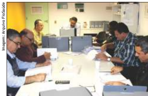
Conselho Fiscal reunido na FioSaúde no mês de junho

Fiscal. Na foto abaixo está o registro da participação desse colegiado durante as reuniões na FioSaúde realizadas entre os dias 21 e 24/6.