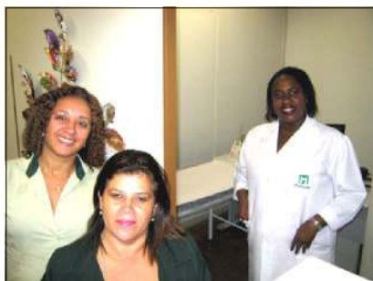
Marcação de consultas e atendimento em enfermagem no novo espaço inaugurado na Policlínica