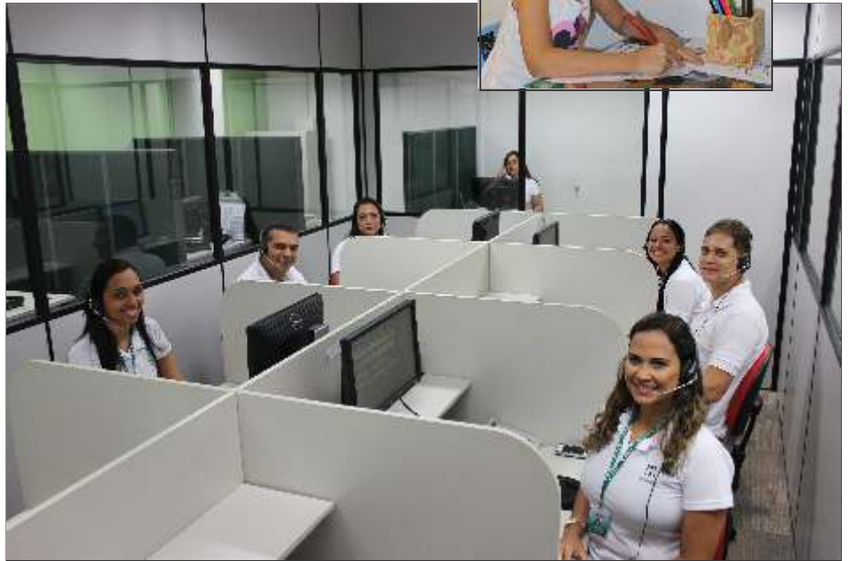
No novo espaço da Central de Atendimento FioSaúde, os destaques são a acessibilidade e o conforto.