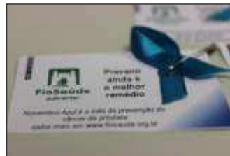
Prevenção de câncer de mama e de próstata: destaques das campanhas Outubro Rosa e Novembro Azul, que contaram com palestras educativas e peças de divulgação.

saber mais sobre o câncer de próstata. Durante todo o mês de novembro, os beneficiários da Caixa de Assistência contarão com isenção de participação nos exames de sangue de dosagem de PSA e nas ultrassonografias de próstata (abdominais e/ou transretais) - mais um incentivo da FioSaúde.