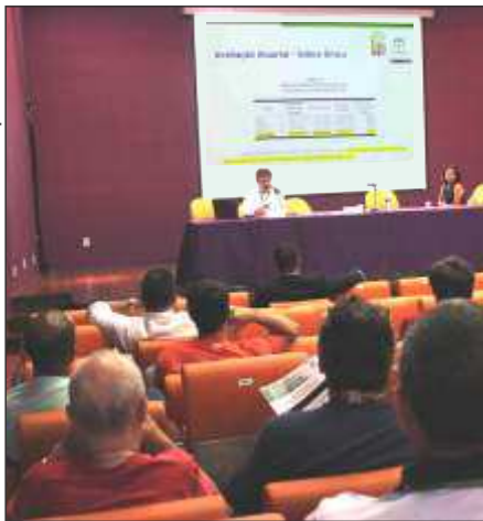
FioSaúde realiza assembleia em 16 de dezembro

No dia 16 de dezembro, no Auditório do Museu da Vida - Manguinhos/Fiocruz, aconteceu a segunda Assembleia-Geral Ordinária da Caixa de Assistência de 2014, na qual foi apresentada aos beneficiários a proposta de nova tabela para o plano de saúde, a ser implantada a partir de janeiro de 2015.