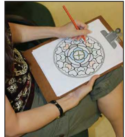
Mandalas para colorir na Policlínica

Algumas das pinturas você confere abaixo. São imagens coloridas e inspiradoras.