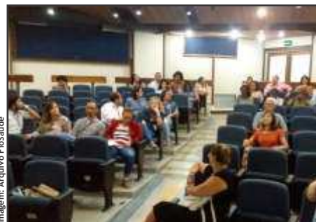
Encontro com beneficiários em Salvador.

Com objetivo de ouvir os beneficiários da Caixa de Assistência e suas sugestões sobre o plano, a Diretoria da FioSaúde visitou, entre os dias 26/4 e 26 de maio, unidades da Fiocruz fora do Rio de Janeiro: Recife, Bahia, Belo Horizonte, Brasília e Manaus.