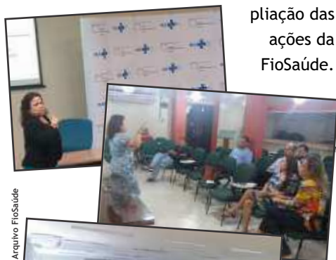
Encontro com beneficiários em Brasília, Manaus e Recife, respectivamente.

com o objetivo de avaliar o grau de satisfação em relação à rede ampliada FioSaúde/Cassi. Todas essas iniciativas serão base para a discussão e criação de um plano que visa o aperfeiçoamento e a ampliação das