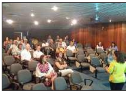
Encontro com beneficiários em Belo Horizonte.

registrou a satisfação em estreitar ainda mais os laços e otimizar os processos envolvendo a rede de prestadores da Caixa de Assistência naquelas localidades.