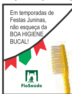
Imagem: Davide Guglielmo/Freeimages

Além disso, está programado para que as crianças presentes na confraternização julina dos trabalhadores do 3º andar do prédio da Expansão da Fiocruz também recebam o material informativo sobre importância da boa higiene bucal na prevenção de problemas odontológicos.