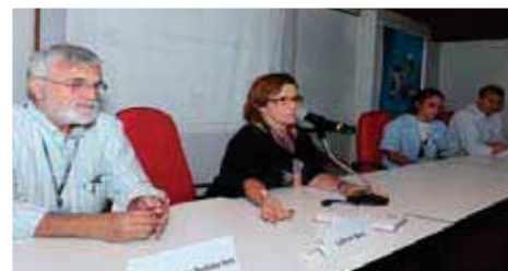
Representantes do Conselho e da Diretoria na reunião no IFF, em 27/4.

As reuniões com beneficiários prosseguiram em outras três datas: no dia 27 de abril, no Instituto Fernandes Figueira, no dia 2 de maio, com o Conselho Deliberativo do INCQS e no dia 6 de junho com os funcionários de FarManguinhos, em Jacarepaguá.