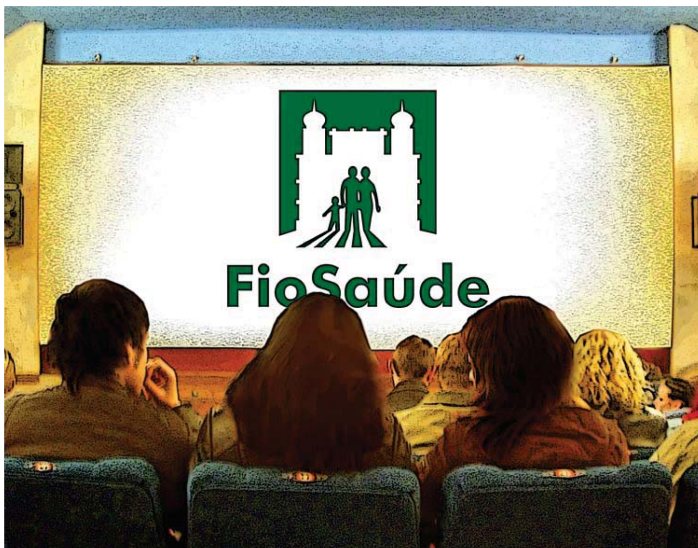
Foto: Montagem meramente ilustrativa sobre foto de Kostya Kalyak/sxc.hu