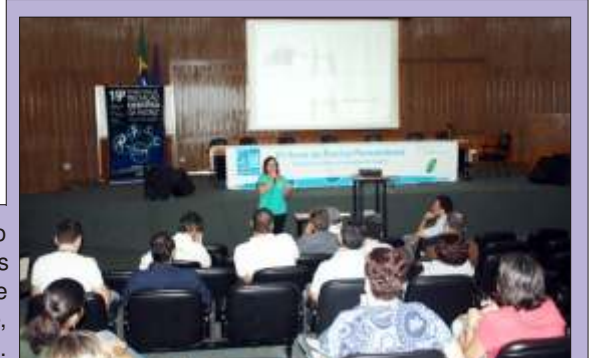
Registro fotográfico da visita dos Diretores do FioSaúde ao C.P.q A.M., em Recife, no dia 26 de outubro.