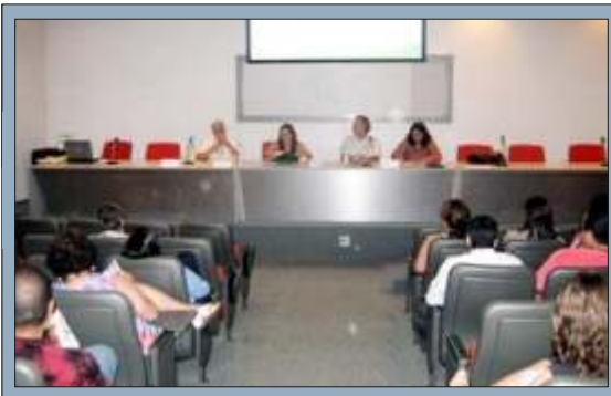
Reunião pública com servidores da Fiocruz, no dia 27/10, no auditório da ENSP.

da Policlínica (serviço próprio) fora do Rio - a Diretoria Técnica vai buscar médicos que possam prestar serviço, funcionando como âncora nesses locais, fazendo monitoramento epidemiológico e implantação de programa de atendimento domiciliar.