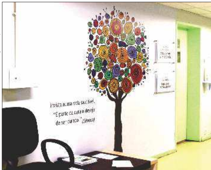
Imagem da recepção da Policlínica FioSaúde com seu painel e visual acolhedor.