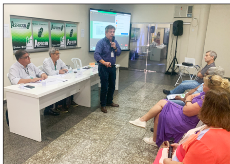
A Diretoria da FioSaúde na Assembleia de 27/2.