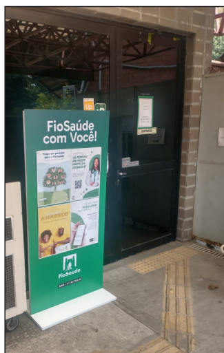
Totem FioSaúde - restaurante BioManguinhos

de prevenção e promoção da saúde, por exemplo.