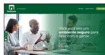
Este é o modelo de homepage do canal

Quer saber como funciona o Canal da Integridade?