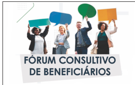
Fórum de Beneficiários agendado para o dia 26 de maio, às 14h, na sede da Asfoc

Durante a primeira quinzena de maio, a FioSaúde disponibilizou uma plataforma de envio antecipado de sugestões por parte de beneficiários interessados, de forma a facilitar o encaminhamento de questões a serem apreciadas previamente pelas gerências e diretorias da FioSaúde, a fim de melhor orientar a discussão dos temas durante o fórum.